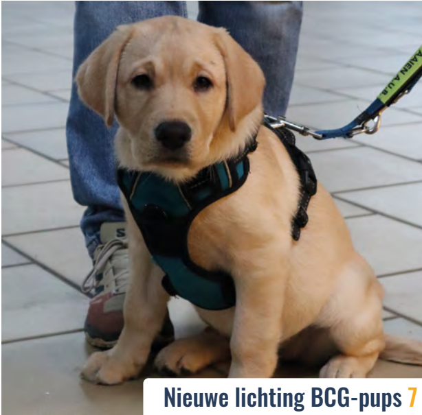
Nieuwe lichte BCG-pups 7