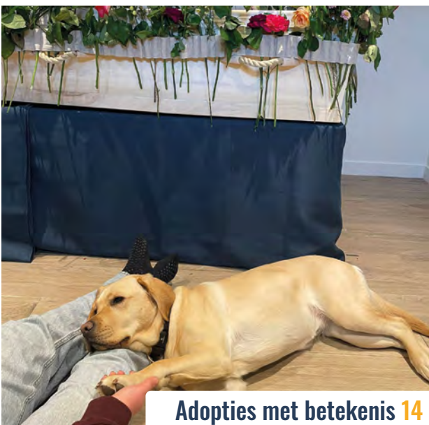
Adopties met betekenis 14