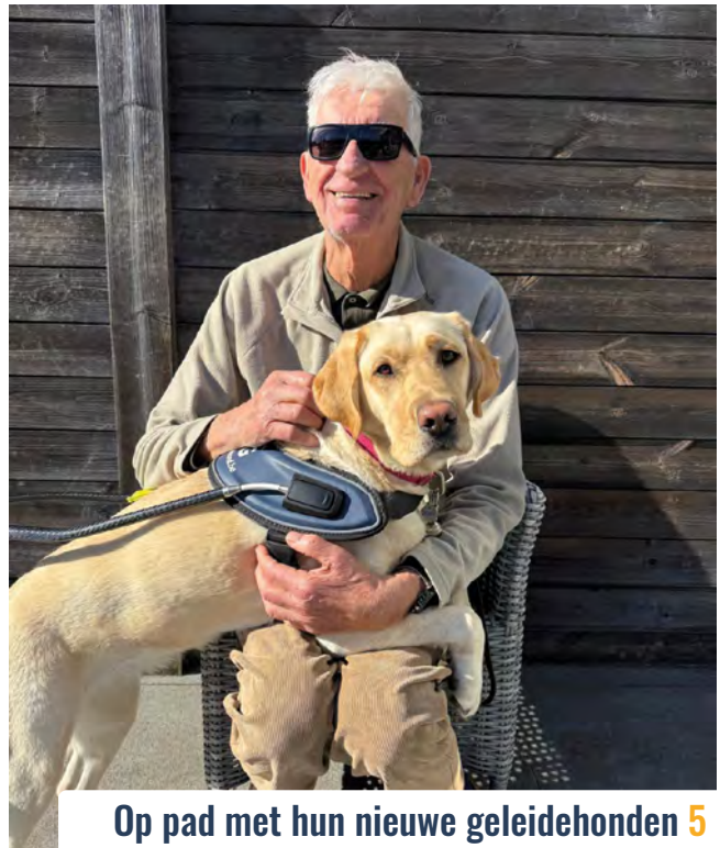
Op pad met hun nieuwe geleidehonden 5

Flash is een gratis digitaal magazine. Een papieren editie wordt verzonden mits een bijdrage van 10,00 euro / jaar voor de verzendingskosten. Deze uitgave bestaat ook in aangepaste leesvorm met name in pdf-formaat en Word-versie zonder afbeeldingen.